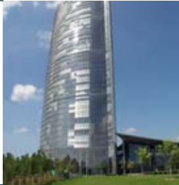
n öffentliche Gebäude