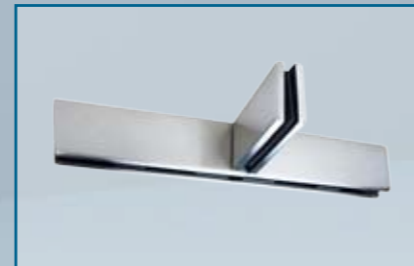
GK 21 – Oberlicht-Gegenkasten/eins. Aussteifung