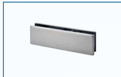
PT 20 – oberer Klemmbeschlag