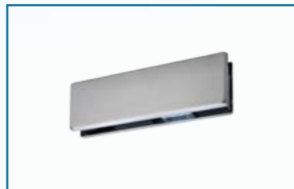
PT 10 – unterer Klemmbeschlag