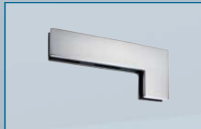
GK 40 – Winkel-Gegenkasten