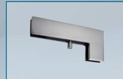
PT 40 – Winkel-Klemmbeschlag