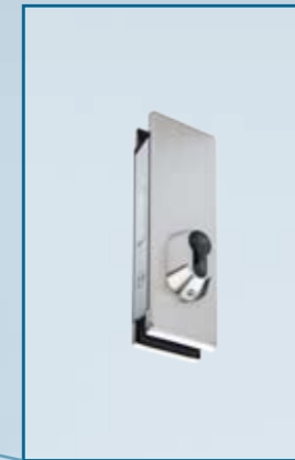
US 20 – Universal-Mittelschloss