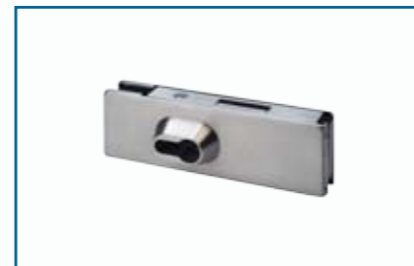
US 10 – Universal-Eckschloss