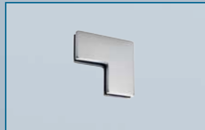
PT 60 – Winkelverbinder