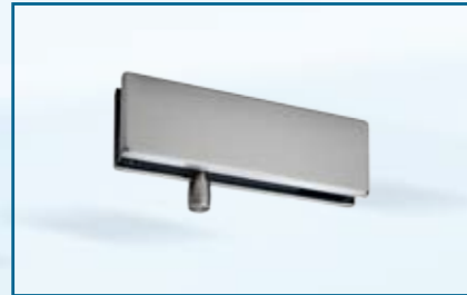
PT 30 – Oberlicht-Klemmbeschlag